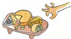
Tabla de quesos 3 o 5 deliciosas variedades 17 / 23